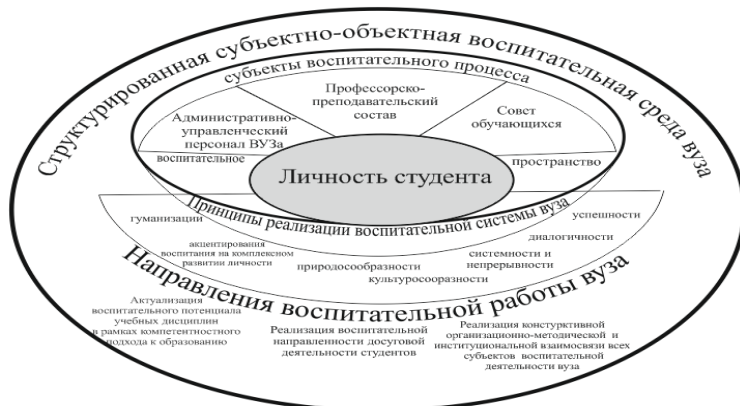
Рисунок 2. Воспитательная система вуза

Структурно воспитательная система вуза в современных социокультурных условиях представлена на основе блочного моделирования, в рамках которого: а) выявлены основные объекты воспитательной системы, а также основные субъекты, причастные к достижению поставленных задач воспитания; б) определена процессуально-организационная сторона и осуществлён выбор механизмов и технологий, усиливающих эффективность каждого компонента системы; в) описаны организационно-педагогические условия эффективной реализации спроектированных компонент педагогической системы.